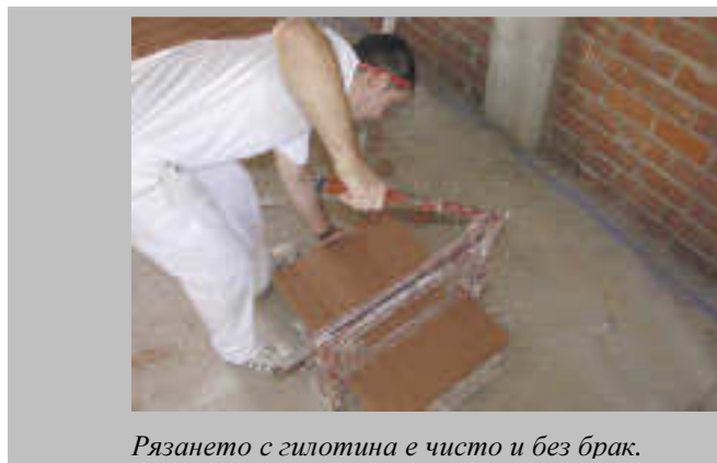
Рязането с гилотина е чисто и без брак.

С използването на специално създадената за рязане на тухли голям формат гилотина на строителната площадка остава минимално количество строителен отпадък. Така имаме един значително по-чист и безопасен обект.