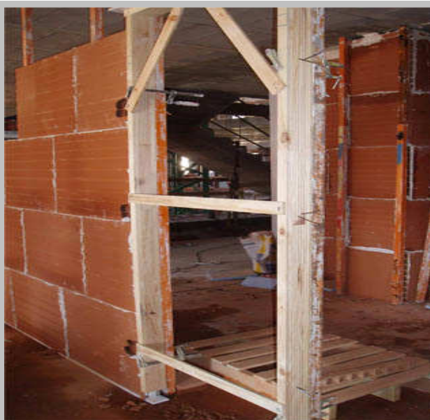
Тухлата със 7 см. дебелина е отдавна изпитано и изключително удачно решение за вътрешни преградни стени.

Нашите вътрешно-преградни стени са от тухла с дебелина 7 см. – HISPAPLANO 7. С довършителните дейности (поставяне на гипскартон или гипсова шпакловка, нашата зидария няма нужда от изравнителна мазилка!) дебелината на стената става 9 см. Спазени са всички изисквания и в същото време се спестява пространство от жилищната площ. Така инвеститорите предлагат помещения с по-голямо жилищно пространство, а техните клиенти получават за същите пари по-просторни домове. А дебелината на касите на вратите е по-малка, което означава поевтиняване на вратите като цяло.