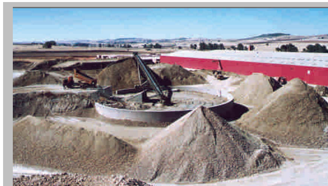
Изключителното качество на керамиката на HISAPLANO се дължи на високото съдържание на монтморилонит в глината, от която се прави.

На пазара у нас се предлагат тухли с над 40% водопопиваемост, а и повечето от производителите дори не показват тази величина, още повече че спойващият материал е с високо съдържание на вода и така още в процеса на зидане стената е напоена с голямо количество влага, която в последствие избива върху довършителните елементи(гипсова шпакловка, гипскартон и пр.).