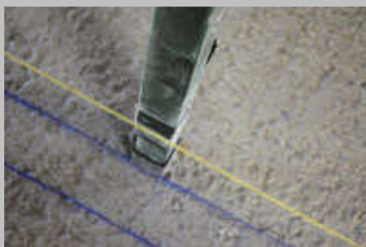
С прави линии върху бетонената конструкция се отбелязват точните места за зидовете.

Правилното разчертаване на проекта върху бетонената конструкция е от изключително значение за строителните процеси на обекта в последствие. Проектът е виждането на клиента как трябва да изглежда неговия дом или офис и това задължава стриктното спазване на плана. При правилно разчертан обект, стените са под прав ъгъл, което спестява време, средства, пари и проблеми при поставянето на подовите настилки (теракот, гранитогрес, ламинат и др.). Правилно разчертаният обект е съобразен и във вертикален план, което означава, че фасадната стена ще се получи права, което отново спестява проблеми при поставянето на външна мазилки, облицовки или изолация.