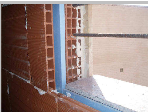
Строителен обект в Испания. Ясно личи външната тухла (в случая зад облицовка), изолацията от фибран и вътрешната тухла.