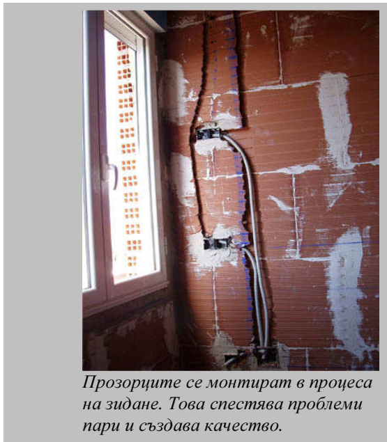
Прозорците се монтират в процеса на зидане. Това спестява проблеми пари и създава качество.

Успоредно със зидарията ние монтираме и касите на прозорците и вратите при идеално спазени нивелации. Прозорците и вратите са с размерите и положението от проекта. При монтирана каса приключването на дограмата е бързо и лесно. Тази система за монтаж е взимствана от най-добрите практики на Западна Европа. Използват се специални скоби, които защипват касата на дограмата и се зазиждат в стената. Така се спестява перфорирането на профила, което запазва неговите високи качества. Така системата за монтаж на дограма осигурява: